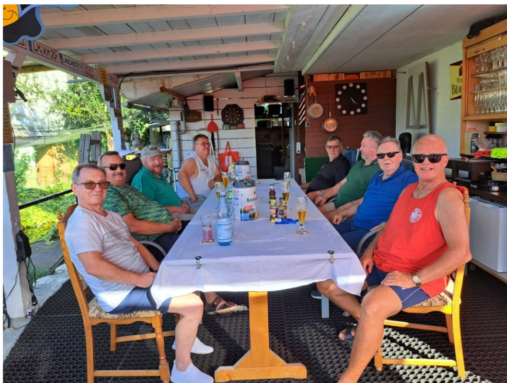
Die TuS Pickleballer in geselliger Runde