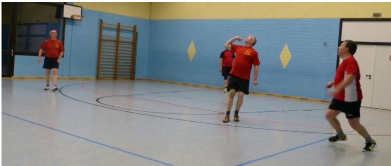
Faustballer in Action...

Auch regelmäßige gesellige Zusammenkünfte und Ausflüge gehören zu den Aktivitäten. Dazu gehören u.a. ein Sommer-Grillfest, der Besuch eines Weihnachts-marktes in unserer Region und ein Jahresabschlussessen in einer Gaststätte.